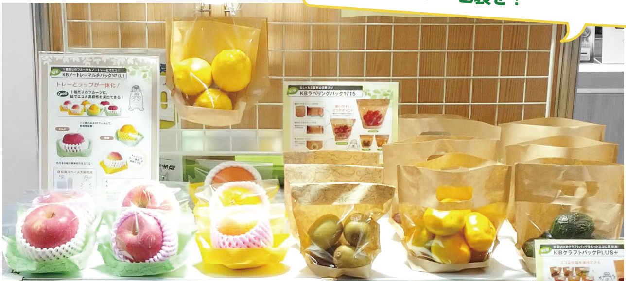
KB ノートレーマルチバック1P(L)