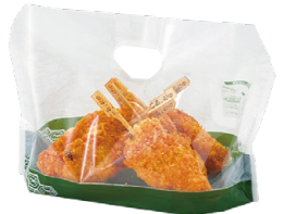
和柄deタッチ®(大) 草色