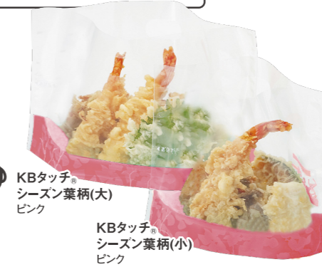
KBタッチ® シーズン葉柄(大) ピンク