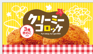
クリーミーコロッケ3種きのこ入り