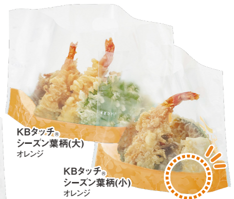
KBタッチ® シーズン葉柄(大) オレンジ