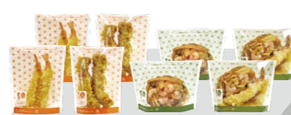
KB和彩デリ®1417 (えび天1〜2本)

容器だと平面的になってしまう売場。KB和彩デリを使うと、立体的でボリューム感ある売場がつかれます!