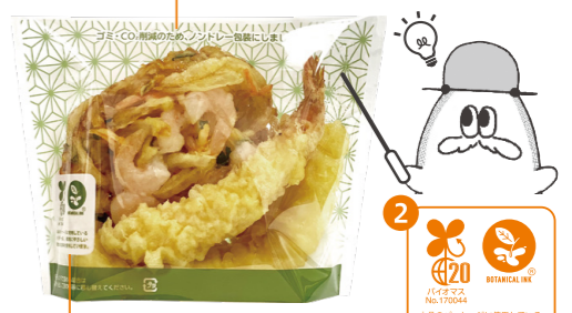
KB和彩デリ®1813 (天盛り1人前)