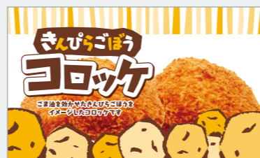
きんぴらごぼうコロッケ