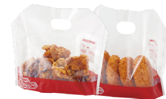
和柄deタッチ®(小) 朱色